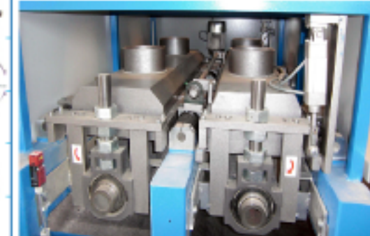
mit Stellager einzeln verstellbar