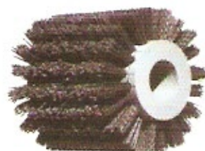
Schleifkornbürste Korn 60/80 Ø 100 Höhe 110 Bohrung 16 u. 19 Ø 100 Höhe 120 Bohrung 16 u. 19 Tornomax Ø 100 Höhe 110 Bohrung 30

Viele andere Abmessungen und Sonderanfertigungen auf Anfrage. Sonderkörnung auf Anfrage.