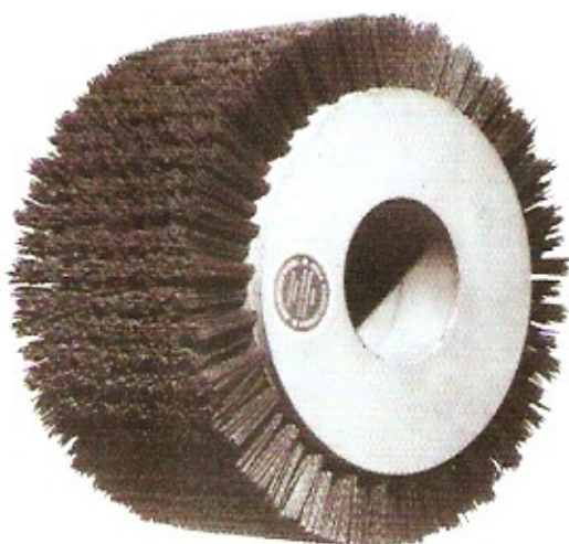
Schleifkornbürste Korn 60/80 Ø 250 Höhe 150 Bohrung 75 (Langzauner) Ø 250 Höhe 150 Bohrung 32 (Hog)