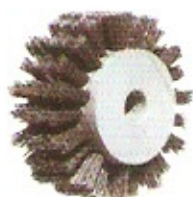
Schleifkornbürste Korn 60/80 Ø 100 Höhe 50 Bohrung 16