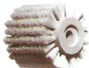
Fieberbürste (zum Wachsen) Ø 100 Höhe 110 Bohrung 16/19 Ø 150 Höhe 110 Bohrung 30 Ø 150 Höhe 120 Bohrung 30