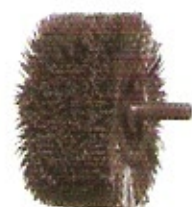
Schleifkorn-Scheibenbürste auf Dorn Korn 80 Ø 100 mit Stützringen zum Strukturieren von Profilen