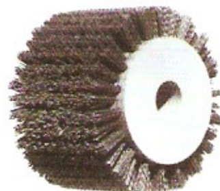
Schleifkornbürste Korn 60/80 Ø 150 Höhe 110 Bohrung 30 Ø 150 Höhe 120 Bohrung 30 Festo Ø 150 Höhe 90 Bohrung 30/16