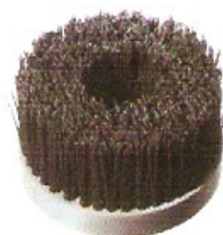
Schleifkorn-Flächenbürste Korn 60/80 Ø 120 Höhe 70 Bohrung M14 Ø 120 Höhe 70 Bohrung 14