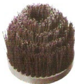
Schleifkorn-Stufenbürste 4 Segmente Korn 60/80 Ø 120 Höhe 120 Bohrung 14