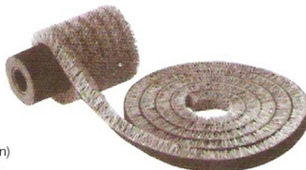
Schleifkornbürste erneuern mit Endlosband, Korn 60/80 - jeder Durchmesser - jede Höhe