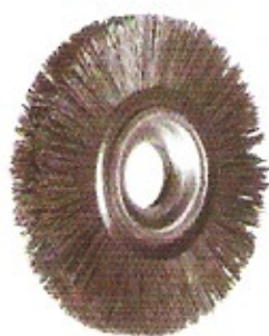
Schleifkorn-Scheibenbürste K80 Ø 150 Höhe 25 Bohrung 30