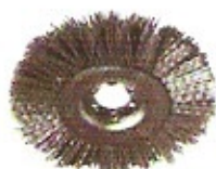
Schleifkorn-Scheibenbürste K80 Ø 100 Höhe 15 Bohrung 16 u. 19