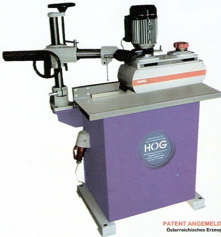
PATENT ANGEMELDET Österreichisches Erzeugnis

In der Standardausführung Rundungen kontinuierlich von 2-18 mm und Fasen bis 25 mm schleifen